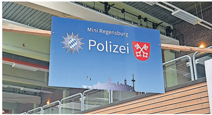
Die Polizeistation war in vollem Einsatz