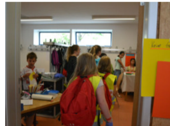
Das Krankenhaus