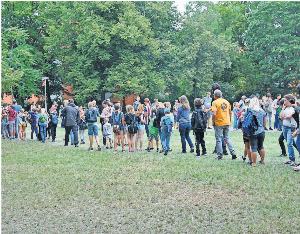
Die lange Warteschlange