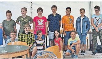
Die Casino Mitarbeiter

Am Dienstag von 13 bis 13.45 Uhr findet auf der Bühne eine große Losziehung statt. Die Lose können bis 13 Uhr im Casino gekauft werden. Pro Los nur 2 Ratiserl und ein großer Hauptgewinn!