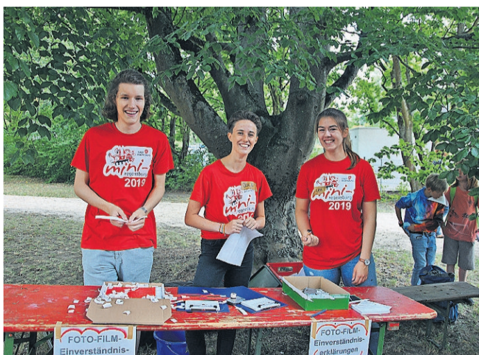
Die fleißigen Mitarbeiter