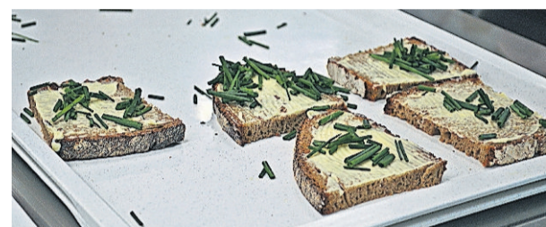
Schnittlauch-Brote füllen den Magen.