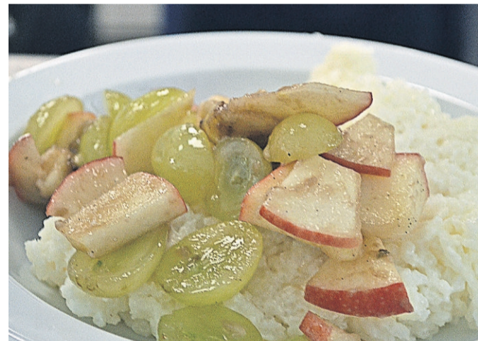
Die mampfende Tradition ist Obstbrei.