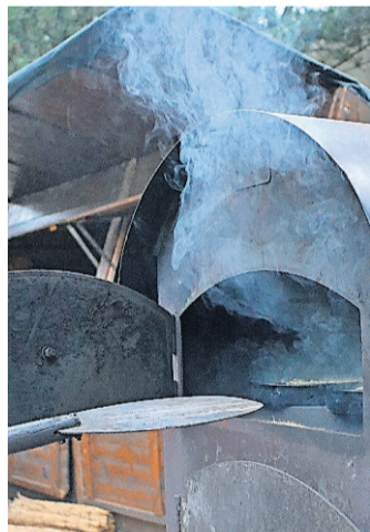
Pizza frisch aus dem Ofen gibt es in Mini-Regensburg.