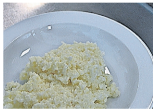
Brei schmeckt super.