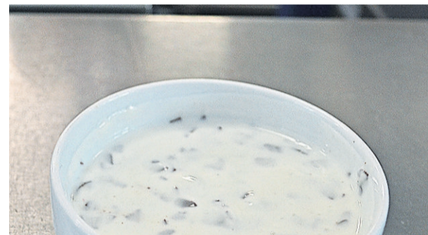
Süße Nachspeisen schmecken lecker.