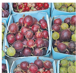
Genug Obst ist wichtig für die Ernährung.