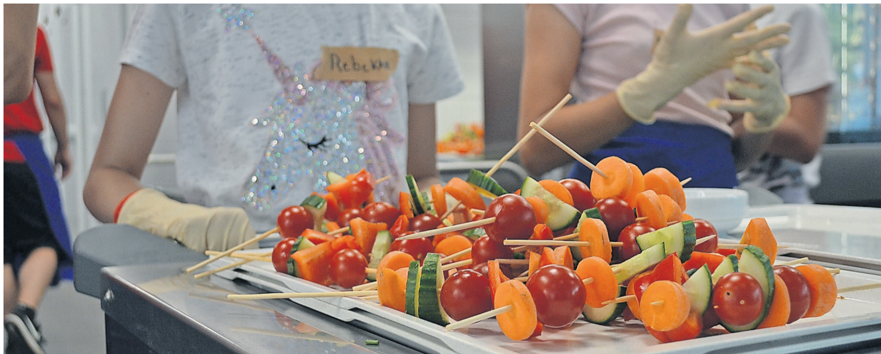
Gemüsespieße vom Mampfenden Maulwurf sind gesund.