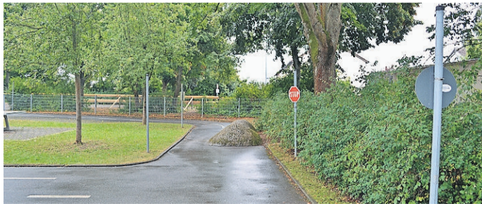
Wegen nassen Straßen konnten keine Fahrprüfungen stattfinden.

Der Spielpark war eine der besonders stark betroffenen Stationen, weil aufgrund des Regens erstmals weder die Hüpfburg, noch die Rollenrutsche verwendet werden konnte. Auch beim Spielverleih waren weniger Kinder anwesend. Insgesamt führte die verringerte Spielmöglichkeit zu weniger Motivation bei den Kindern. Beim Stockbrotstand kam es zu keinen größeren Verzögerungen, obwohl erst später