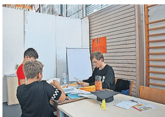
Doktor und Doktorantin