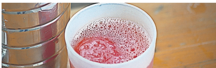
Der Cocktail Red Sky

meinte, dass die Ausstellung wichtig sei, da bei nicht allen Kindern der Welt das Einhalten der Kinderrechte so überwacht wird wie bei uns in Europa. Die Ausstellung ist sehenswert, da man viel über Kinderrechte lernen kann. Text: Franziska