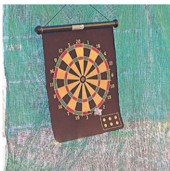
Die Dartscheibe der Mini-Wiesn