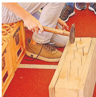
Beim Nägelschlagen ist Geschick gefragt.