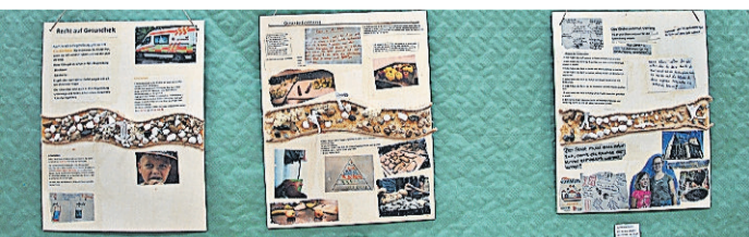
Die Kinderrechte Ausstellung im Mini-Museum

Jonas (12): Kettcars für das Krankenhaus, um Verletzte zu transportieren