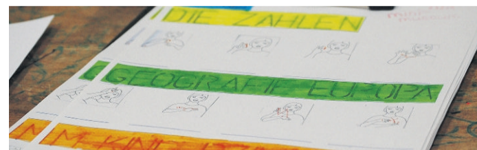
Das Gebärdensprache-Quiz

finde, dass er süß und im Nachgeschmack leicht bitter ist. Man schmeckt etwas Grapefruitsaft heraus. Außerdem besteht der Cocktail aus Apfelsaft, Pfirsichsaft- und Sirup, Sauerkirschsaf, Grapefruitsaft und Granatapfelsirup. Text: Iris (11)