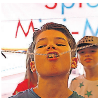
... und beim Brezenschnappen